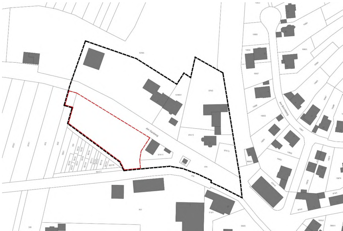
Bild 1: Katasterauszug mit Geltungsbereich, rot markiert der Teil des Bebauungsplanes, welcher nach § 13b BauGB aufgestellt werden soll (siehe Ziffer 3)

Das Plangebiet umfasst die Flurstücke 874 (teilweise), 874/2, 874/8, 874/11, 874/12, 874/13 und 10165 (teilweise). Die Größe des Plangebietes beträgt ca. 1,59 ha.