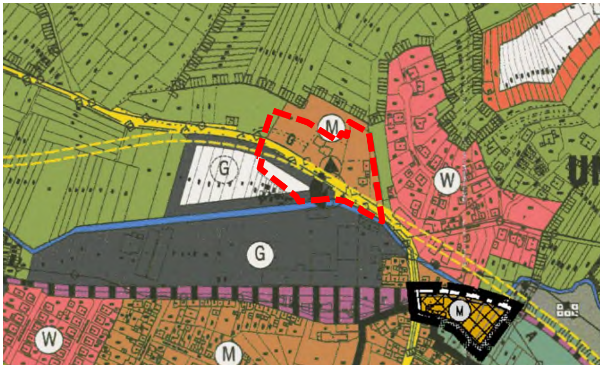
Bild 8: Flächennutzungsplan der Stadt Kraichtal, Ausschnitt Unteröwisheim, mit Plangebiet (rote Kontur)

Der Bebauungsplan entspricht nicht der Darstellung des Flächennutzungsplanes. Da der Bebauungsplan im beschleunigten Verfahren aufgestellt wird, kann jedoch von den Darstellungen des FNP abgewichen werden. Im Zuge der nächsten Fortschreibung ist der FNP zu berichtigen.